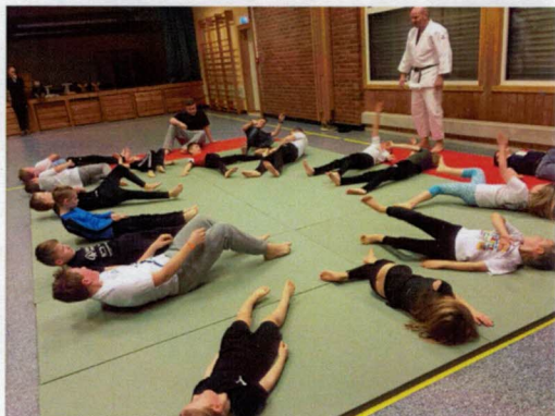
Judotrening i gang.

Både ballspillgruppa og aerobicgruppa, som ledes av henholdsvis Tommy Skullerud og Marit Tveten, starter begge opp igjen i januar måned, så sant forholdene tillater det. Kongemarsjen går av stabelen i september 2021.