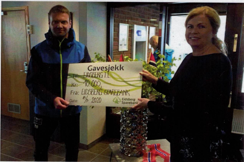
Eidsberg sparebank bidro godt i klubbkassa.