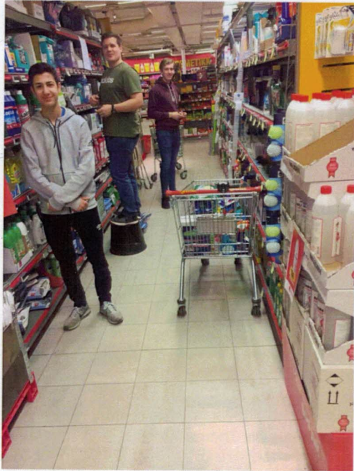
A-laget hadde varetelling som dugnad på Coop Ekstra.